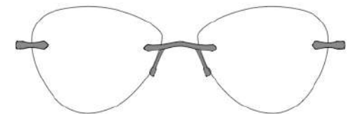
Luna 03 | 55 - 15