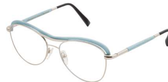
03 – Palladium / light blue bird's eye maple Palladium / érable moucheté bleu pastel