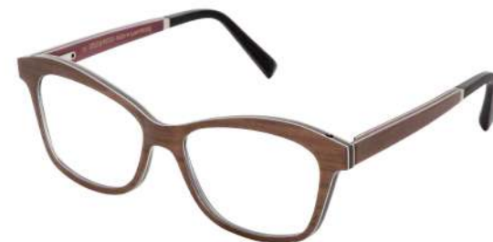
42 – Brown tanganyika / brown bubinga / burgundy bolivar Tanganyika brun / bubinga brun / bolivar bordeaux