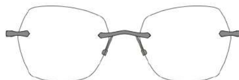
Luna 05 | 53 - 18