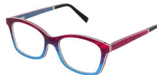
07 — Red-electric blue silk / burgundy bolivar / electric blue birch Soie rouge-bleu électrique / bolivar bordeaux / bouleau bleu électrique