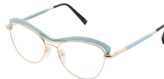
02 – Champagne gold / light blue bird's eye maple Or champagne / érable moucheté bleu pastel