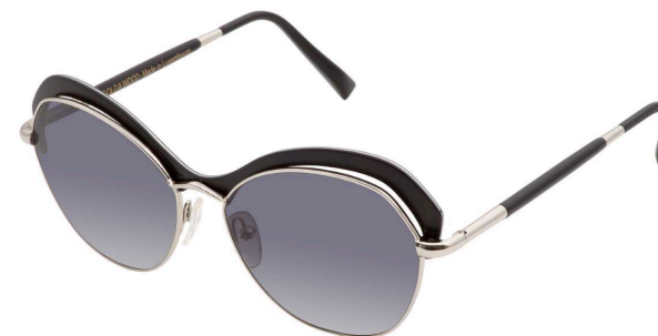
03 – Palladium / ebony tanganyika / grey gradient Palladium / tanganyika ébène / gris dégradé