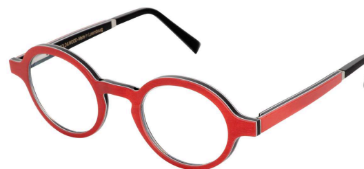
41 –Red bolivar / black bubinga / ebony tanganykia Bolivar rouge / bubinga noir / tanganyika ébène