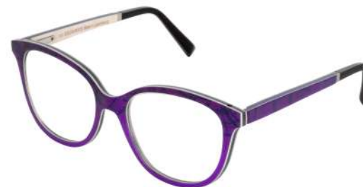
07 – Purple-dark blue silk / blue bolivar / white curly maple Soie violette-bleue foncée / érable déroulé ondé blanc