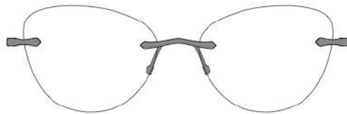
Luna 01 | 54 - 17