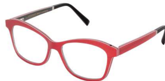
41 – Red bolivar / red tanganyika / grey bolivar Bolivar rouge / tanganyika rouge / bolivar gris