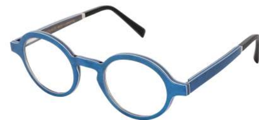
42 –Radica blue madrona / electric blue birch / grey oak Ronce de madrona bleue / bouleau bleu électrique / chêne gris