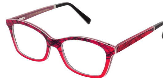
05 — Red-dark blue silk / Burgundy bolivar / red bird's eyes maple Soie rouge-bleue foncée / bolivar bordeaux / érable moucheté rouge