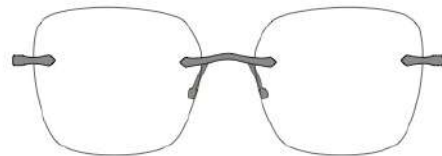
Luna 04 | 54 - 17