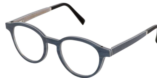
40 – Blue jeans bolivar / dark blue bolivar / grey eucalyptus Bolivar bleu jeans / bolivar bleu foncé / eucalyptus gris