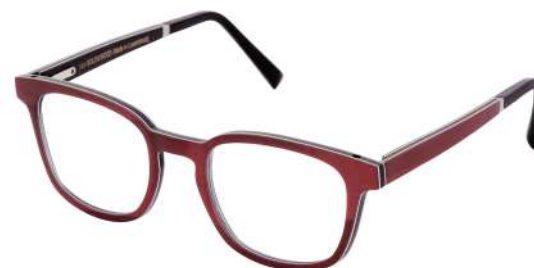
41 – Burgundy bolivar / black bubinga / ebony tanganyika Bolivar bordeaux / bubinga noir / tanganyika ébène