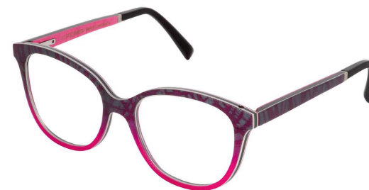
05 – Grey-fuchsia silk / grey bolivar / fuchsia curly maple Soie grise-fuchsia / bolivar gris / érable déroulé ondé fuchsia