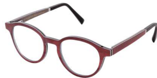
41 – Burgundy bolivar / brown bubinga / brown bird's eye maple Bolivar bordeaux / bubinga brun / érable moucheté brun