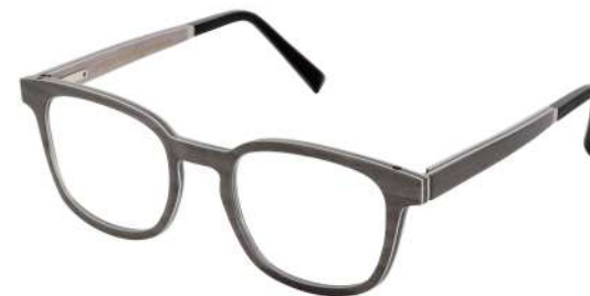
40 – Grey bolivar/ grey eucalyptus Bolivar gris / eucalyptus gris