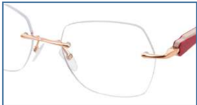
Col 6 = Shiny gold champagne / Or champagne brillant