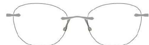
Luna 09 | 52 - 17