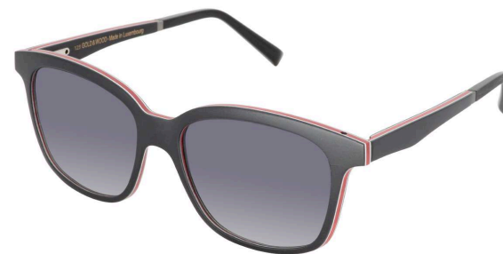
01 – Ebony tanganyika / red bolivar / grey gradient Tanganika ébène / bolivar rouge / tanganyika ébène / gris dégradé