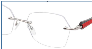
Col 27 = Shiny gun / Gun brillant