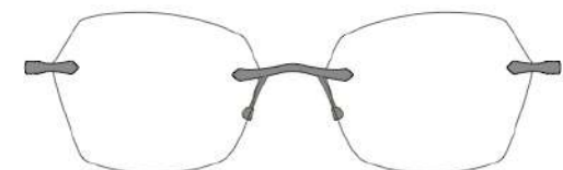
Luna 06 | 53 - 17