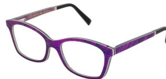
06 — Purple-navy blue silk / blue bolivar / plum bird's eyes maple Soie violette-bleu marine / bolivar bleu / érable moucheté mauve