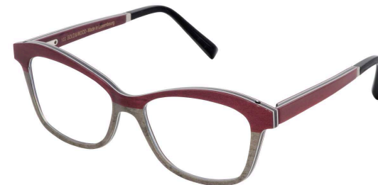
40 – Burgundy bolivar – grey bird's eye maple / grey bolivar / red bird's eye maple Bolivar bordeaux – érable moucheté gris / bolivar gris / érable moucheté rouge