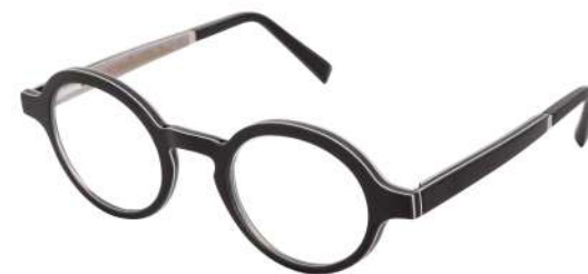
40 – Ebony tanganyika / grey eucalyptus Tanganika ébène / eucalyptus gris