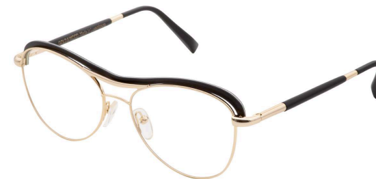
01 – Champagne gold / ebony tanganyika Or champagne / tanganika ébène