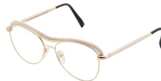
02 – Champagne gold / white curly maple Or champagne / érable déroulé ondé blanc