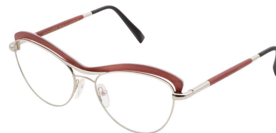
03 – Palladium / burgundy bolivar Palladium / bolivar bordeaux