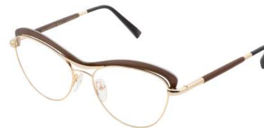
01 – Champagne gold / brown tanganyika Or champagne / tangaïka brun