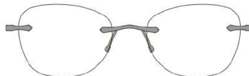
Luna 08 | 49 - 18