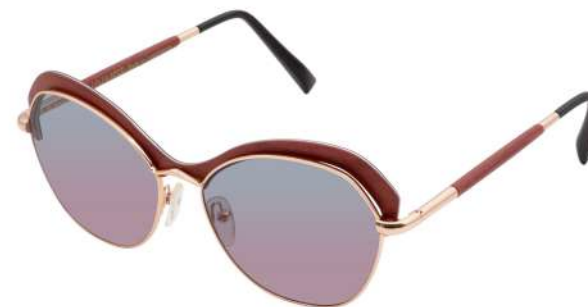
01 – Champagne gold / brown tanganyika / brown gradient Or champagne / tanganyika brun / brun dégradé