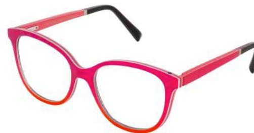
06 – Red-orange silk / Coral bolivar Soie rouge-orange / bolivar corail