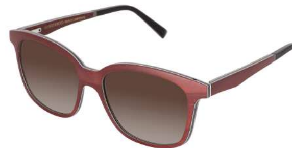
03 – Burgundy bolivar / grey bolivar / brown gradient Bolivar bordeaux / bolivar gris / gris dégradé