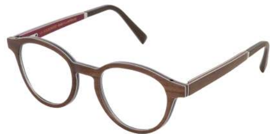
42 – Brown tanganyika / brown bubinga / burgundy bolivar Tanganika brun / bubinga brun / bolivar bourgogne