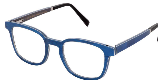
42 – Radica blue madrona / electric blue birch / grey oak Ronce de madrona bleue / bouleau bleu électrique / chêne gris