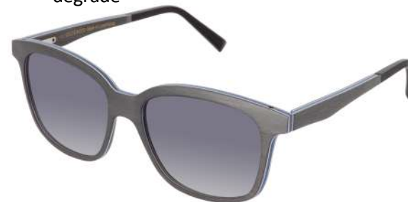
02 – Grey bolivar / electric blue birch / grey gradient Bolivar gris / bouleau bleu électrique / gris dégradé