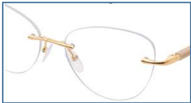
Col 0 = Shiny rose gold / Or rose brillant